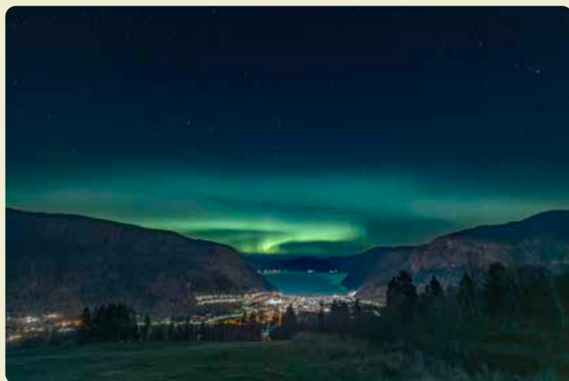
Nordlysbilde.