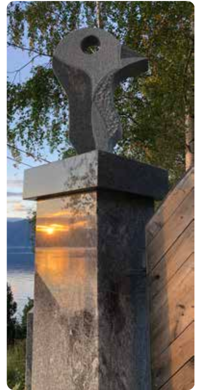
Eine portstolpen i Juvik med Hugin eller Munin på toppen.

For at fleire skal kunna ta del i det vi har bygd opp, og med eit ynskje om å setja Vik på kar-