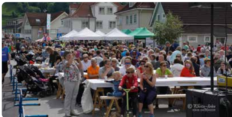
Velkommen til frukost på kommuneplassen laurdag.

50 kr pr person. Inntektene går til lag og organisasjonar.