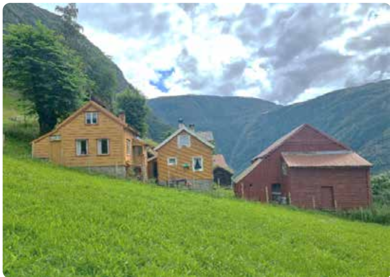
Ytre Le sommaren 2023.