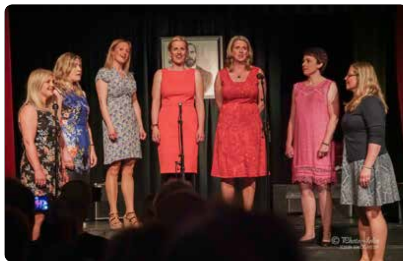
Gygrene blir og med på Kulturkvelden.

- Me håpar publikum går ut frå kulturkvelden litt gladare, kvikkare og stoltare av å vere vikle enn før dei kom, seier Lillesvangstu.