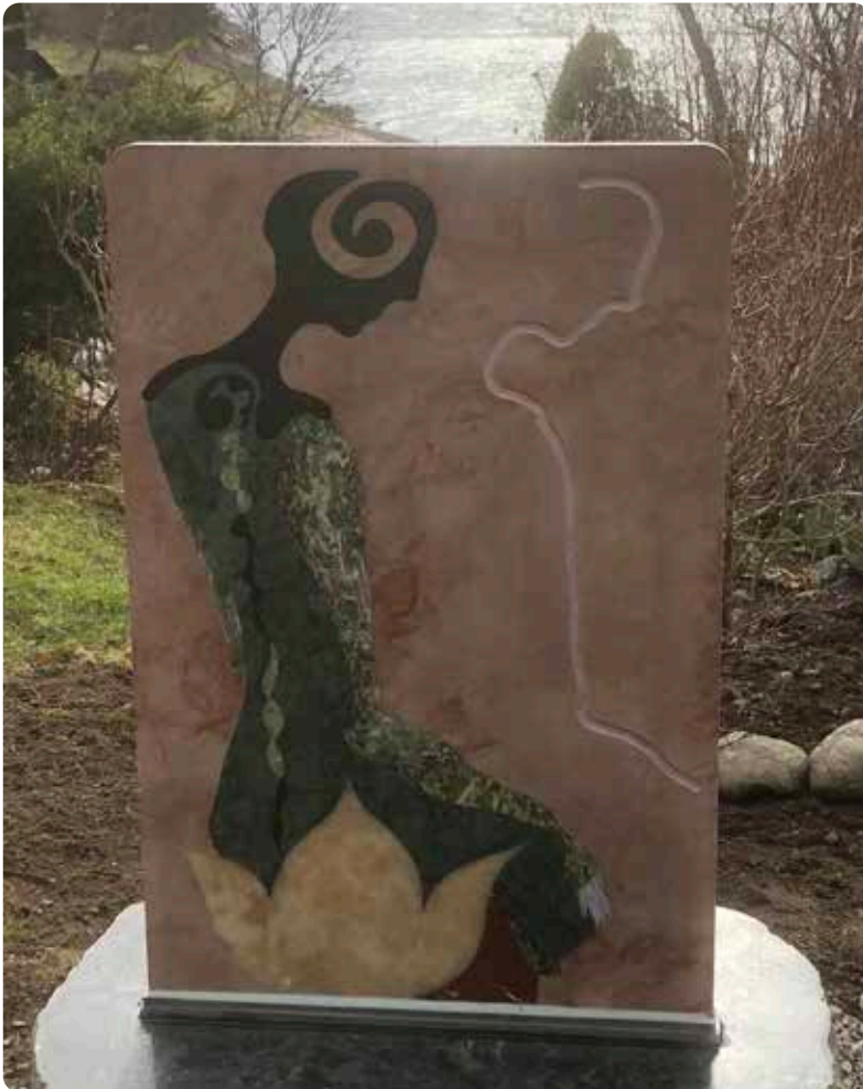
Den nye skulpturen som er komen på plass i hagen. Den er i kvarts, teikna av Anup og laga i Firenze. Dei som kjem på besøk får høyra om symbolikken.

Vi har tatt med oss inspirasjon frå kunst, mytologi, filosofi